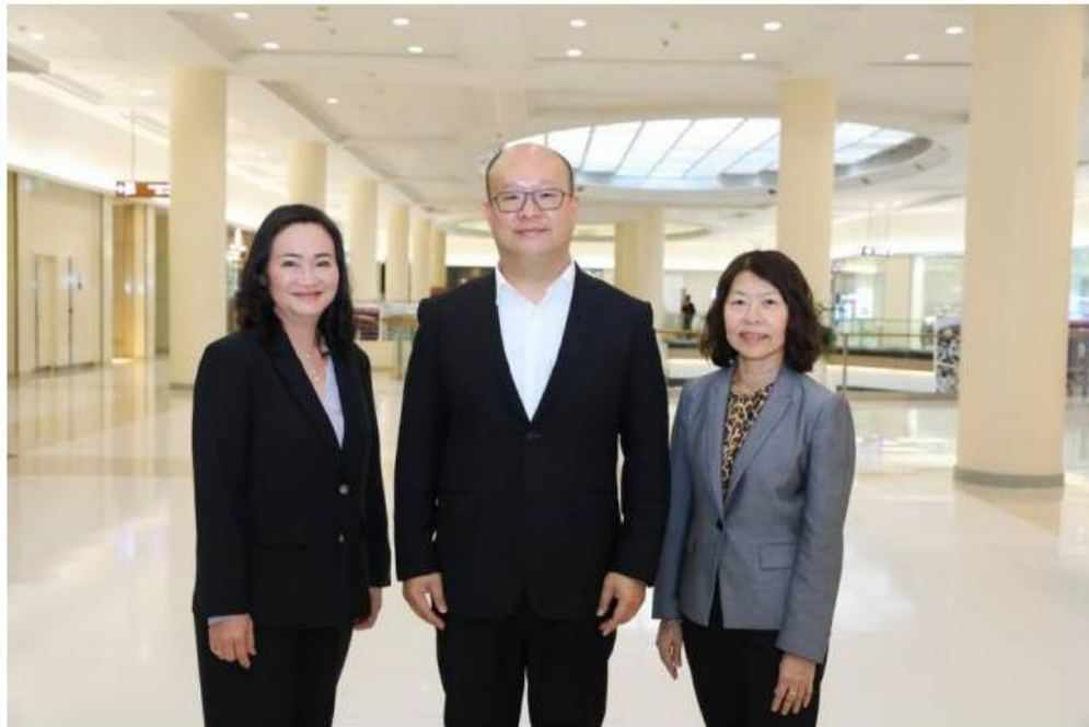
“IMPACT” ทางแผน บันอาณาจักรสู่ Smart City ลุยขยายฐานรับอีเวนต์-คอนเสิร์ตระดับโลก

Like 153K people like this. Sign Up to see what your friends like.